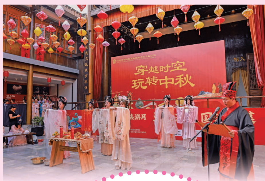
▲第三屆海昏漢文化旅遊月活動大展開幕。

如今，南昌幾乎月月有活動，活潑多樣的網絡話題表達樣式、不拘一格的活動創新思路、熱鬧親民又不失嚴謹的旅遊環境，一場場展現英雄城雄姿、英雄城品格的城市活動背後，折射出的是南昌在「天下英雄城」品牌傳播和推動文旅市場復甦上做出的不懈努力，在提升城市品牌美學、挖掘城市文化內涵上做出的積極探索。