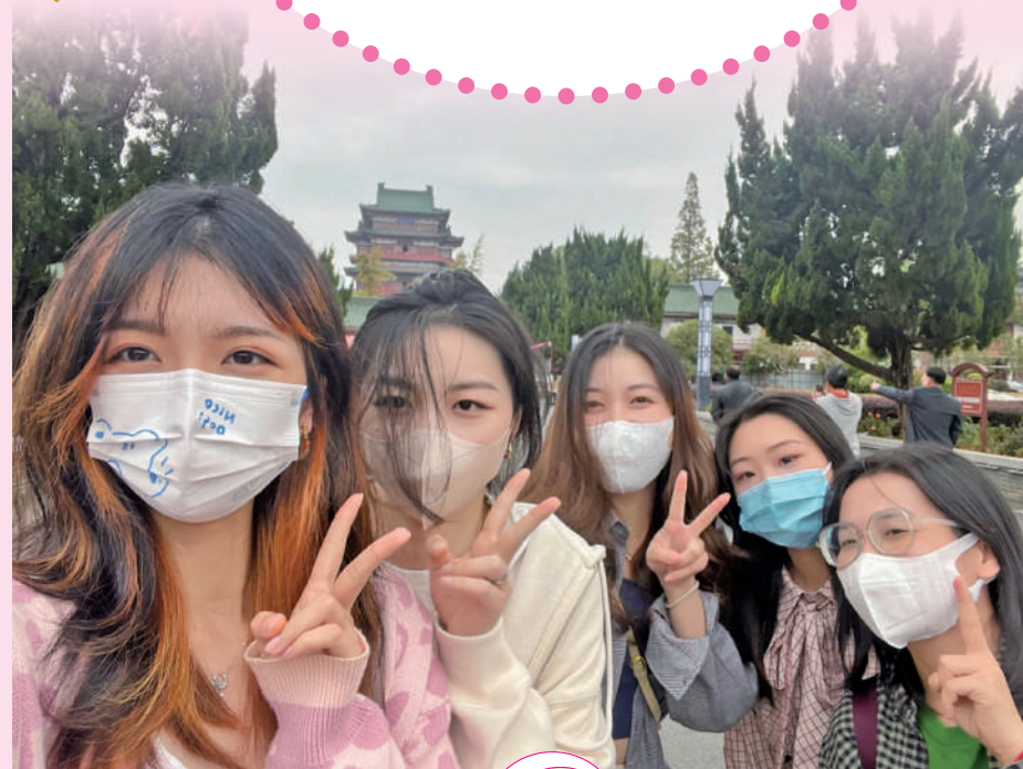
▲大學生「特種兵式」旅遊打卡南昌。

南昌市委常委、宣傳部部長李松殿表示，文旅產業對提升城市經濟發展品質和自身形象氣質至關重要，要充分挖掘自身稟賦，精心組織文旅活動，提升南昌美譽度、知名度。