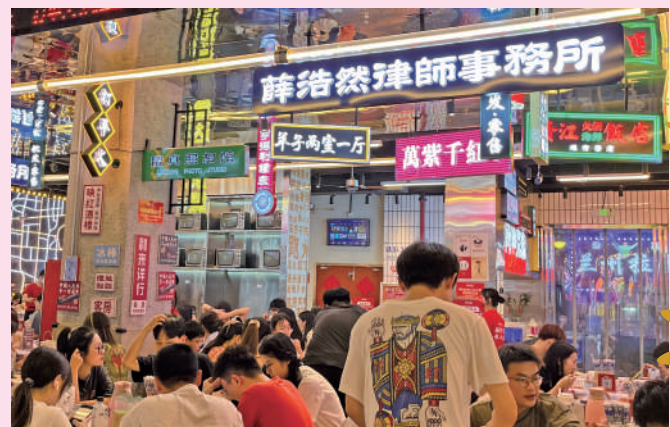
▲人氣滿滿的小吃店。