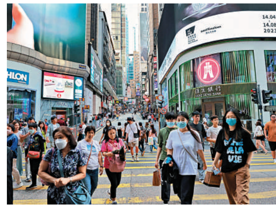
▲香港千萬富翁的身家「縮水」，淨資產總值中位數為1600萬元，按年跌約3%。

【大公報訊】中國人普遍重視家庭關係。調查發現，不少千萬富翁願意在子女的不同人生階段提供財務支持，當中涵蓋置業、婚禮、創業，以至海外升學等。在協助子女置業方面，近七成千萬富翁願意協助子女「上車」，平均金額為240萬元。