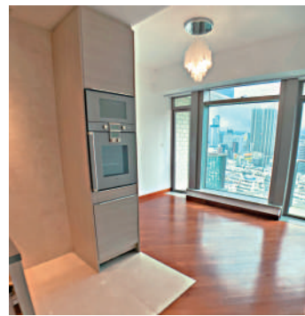
▲油麻地御金·國峯一房戶本月月底以595萬元拍賣。

另邊廂，由信興電子集團持有的上環永安集團大廈14樓全層，面積15946方呎，上月連租約以3.47億元易手，呎價約2.18萬元。資料顯示，買家為「玩具大王」蔡志明有關人士，該單位目前由醫療中心租用，月租70萬元，租金回報約2.4厘。