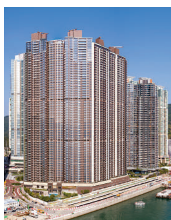
▲LP6二手造價再創新低。