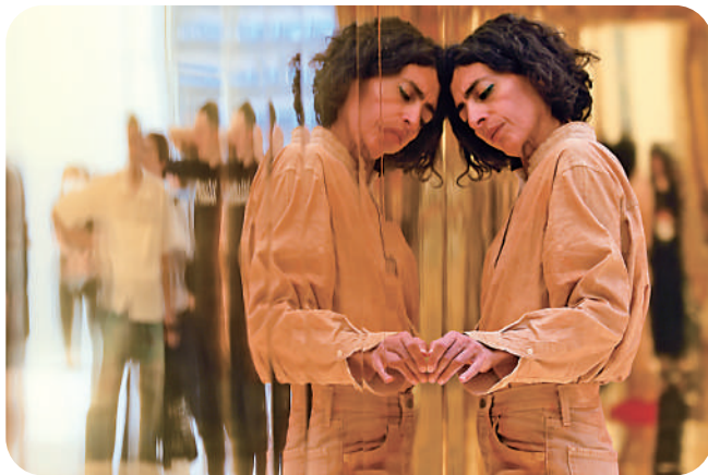
兩位舞者正在表演，她們的動作和表情充滿了情感。