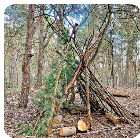
▲學生們在森林校區搭建的臨時「避難所」。

老師有時候會刻意安排平日不在同一個「朋友圈」的同學一起做學科項目，也會在學生不排斥和反對的情況下安排男生和女生一起合作。而每兩年全年級的同學會全部打亂以後重新分班，這既給了他們足夠的時間建立深厚的友誼，也讓他們有機會發現和結交到新的朋友。 在學業上來說，最大的變化是淡化了「班級」這個概念。小學的時候，學生大部分時候是坐在教室裏，以一個班級為單位等待着各個學科的老師們來給他們上課。而在中學裏，他們曾經的「固定教室」變成了一個他們可以休息和自習的休息室，並不在這裏上課。更多的時候，他們是抱着自己的文件夾背着書包去到各個學科教室去上課。慢慢地，不同的學生會選擇不同的科目，所以不同科目上課的同學有來自自己班級的，也有其他班級的。他們打交道的，更多的是以