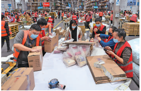
菜鳥為全球最大的跨境電商物流企業。

料菜鳥估值將低過同業。另有分析指出，近期港股十分疲軟，即使菜鳥實力雄厚，但遇上大環境不利，亦很難突圍而出，加上當前環球經濟不振，各種地緣政治風險都對貿易有不良影響，投資者應考慮有關因素。 資料顯示，菜鳥日均包裹量不斷增長，從2017年6月底止3個月的約70萬件，大幅增加到截至今年6月底止3個月的約480萬件。用戶方面，菜鳥除了直接為天貓國際及天貓淘寶海外平台上的商家提供服務，更積極擴展阿里巴巴生態體系以外的其他國際電商平台及線上渠道的商家與品牌，以及傳統電商以外的行業，如汽車、新能源及其他工業製造商。