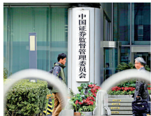
中證監表示，將持續強化融券業務監管，及時總結評估融券機制運行效果。

節，更好發揮融券機制的積極作用。 上海證券交易所和深圳證券交易所隨後公布具體安排，提高融券保證金比例將由本月30日起實施。兩所並公布其他措施，其中戰略投資者在5個交易日內單日出借股份數量佔獲配股份總數不得超過20%；合計出借股份總數佔比不得超過50%等，其他相關限制由周一（16日）起實施。 據市場人士初步測算，保證金比例調整後，預計融券新增規模減少40%左右；限制部分戰投出借，在上市初期減少融券比例約60%至70%。