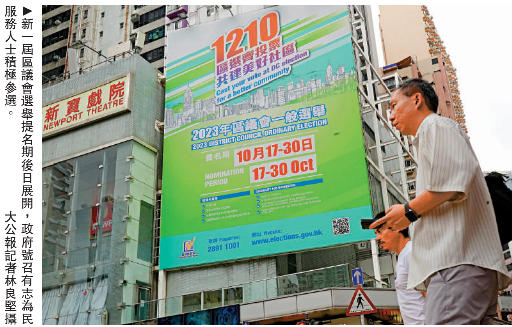
新一屆區議會選舉提名期後日展開，政府號召有志為民服務人士積極參選。