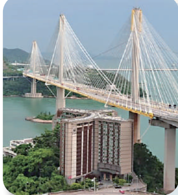
▲新地將汀九橋下方帝景酒店改建為住宅單位，已經獲批。

另位於紅磡的海韻軒及海灣軒兩家大型酒店，長實在5、6年前商廈炒風極旺時，曾欲作商廈重建，並於2018年獲批商廈建築圖則之餘，市場更盛傳當時長實連項目圖則一併放售，惜商廈市道其後回落，兩家酒店重建及放售事宜也不了了之。長實近年轉向向城規會申請改建為住宅，現仍待排期審批，如果成功，則共可提供超過3100個住宅單位。至於位於葵涌的雍澄軒，長實早在10年前已曾拆售酒店房的擁有權予普通投資者，惟因證監會視之為一項集體投資計劃而要受規管，令長實被逼放棄拆售，