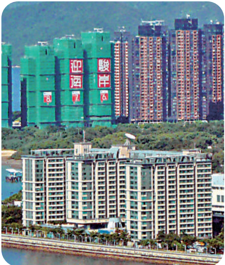
▲馬鞍山海澄軒(下方建築物)已獲批改建為住宅，目前正洽商補地價中。