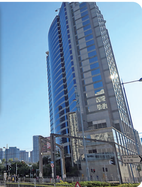
▲嘉湖海逸酒店，開業超過二十年，決定將酒店房間改建為住宅單位出售。