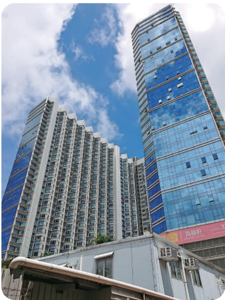
▲紅磡海韻軒可建樓面122萬方呎，將改建為住宅，但會保留546間酒店房。