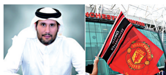
▲阿勒薩尼（左）50億英鎊的出價，與曼聯老有距離。

【大公報訊】綜合BBC、獨立報報道：「紅魔」曼聯賣盤事宜出現較明確方向，買家之一、卡塔爾伊斯蘭銀行主席阿勒薩尼已退出收購，現只餘下英國首富、英力士創辦人拉傑夫（圖圖）接洽，而後者答應從目前老閣格拉沙家族手中收購25%股權，現就有待正式落實。