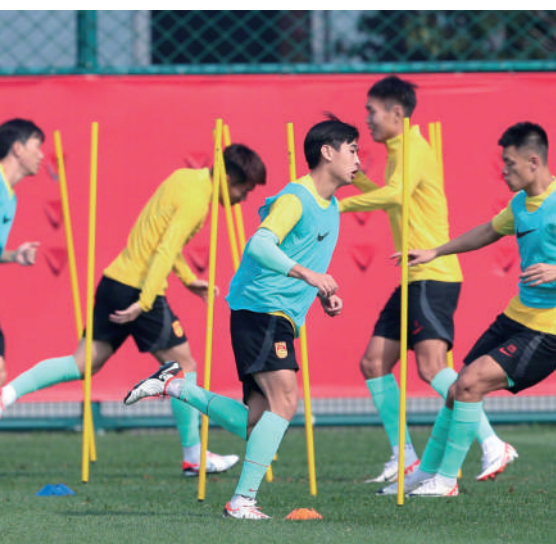
▲國足球員賽前積極備戰。

【大公報訊】中國國家足球隊今晚（16日）繼續布陣大連，準備主場對烏茲別克斯坦的友賽，為11月兩場世界盃外圍賽前，作最後實力檢閱。而今場對烏茲別克斯坦，相信就是備戰明年1月亞洲盃首場分組賽對另一中亞球隊塔吉克斯坦。烏隊目前世界排名較國足高5位，前者亦是國足在其他國際賽的競爭對手，如一舉打敗他們，必可大大增強國足的信心。（今晚7時35分開賽）