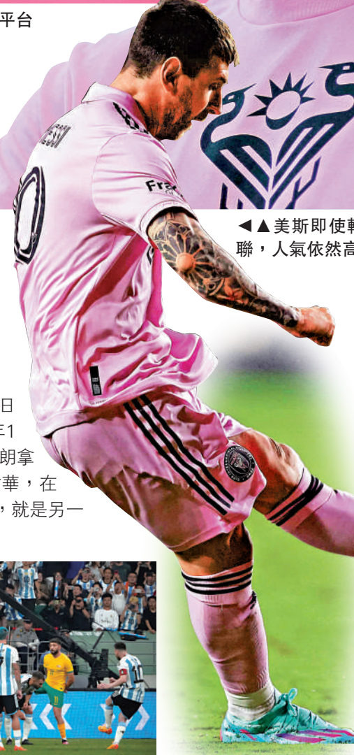
▲美斯即使轉戰美職聯，人氣依然高企。