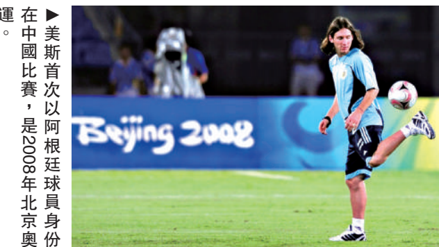
▲美斯首次以阿根廷球員身份在中國比賽，是2008年北京奧運會。

今次邁亞密訪華，也許只是世界頂級球星逐一前來中國的開端。日前網上流傳已有公司正在籌辦明年1月，邀請有美斯宿敵、葡萄牙球星C朗拿度在陣的沙特阿拉伯球隊艾納斯訪華，在成都友賽成都蓉城；到後年的目標，就是另一位已轉戰沙特聯賽的巴西球星尼馬。