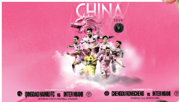
▲國際邁亞密昨日在社交平台公布11月訪華消息。

【大公報訊】時隔不足半年，中國球迷下月初再有機會一睹「阿根廷球王」美斯的風采！美斯現效力的美職聯球隊國際邁亞密確定將於11月訪華，並在5日和8日分別友賽青島海牛及成都蓉城兩支中超球隊，美斯亦確定隨軍，預計期間他將出席若干商業活動。今次是繼6月隨阿根廷在北京友賽澳洲之後，美斯再次訪華，亦是其職業生涯的第9次，而球會老闆之一的碧咸也可能隨行，中國球迷有福了。