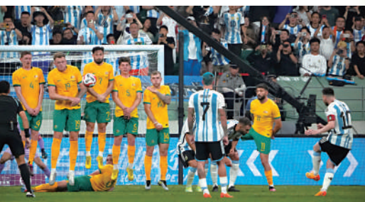
▲美斯（右）6月在中國友賽澳洲，阿根廷以2:0勝出。