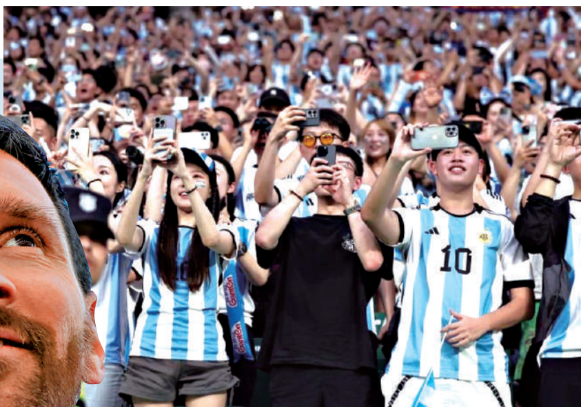
▲美斯6月率阿根廷國家隊訪華時，大批中國球迷穿上10號的阿根廷球衣入場觀戰。