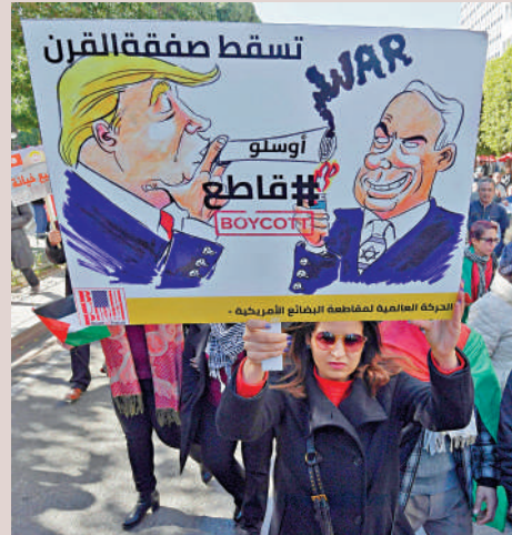
▲ 阿拉伯國家突尼斯的示威者2020年抗議美國推出的所謂「世紀協議」。

加沙地帶面積約365平方公里，目前約有230萬人生活在這裏，人口密度達到每平方公里5500人，與以色列的每平方公里約400人形成鮮明對比。據半島電視台報道，超過60%的加沙居民是來自現以色列境內的難民。1948年以色列建國後，超過75萬巴勒斯坦人被驅逐出家園。1948年至1973年，以色列在四次中東戰爭中侵佔了巴勒斯坦人的大部分領土，目前實際控制面積約為2.5萬平方公里，是巴勒斯坦控制面積的10倍。