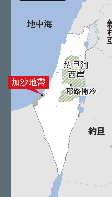
■ 以色列 ■ 巴勒斯坦 ■ 聯合國託管 ■ 約四成領土由巴人控制，六成受以色列控制