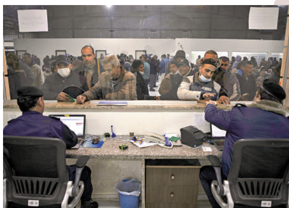
▲ 以色列僅在加沙發放少量工作許可。圖為2022年3月，加沙工人等待入境以色列。