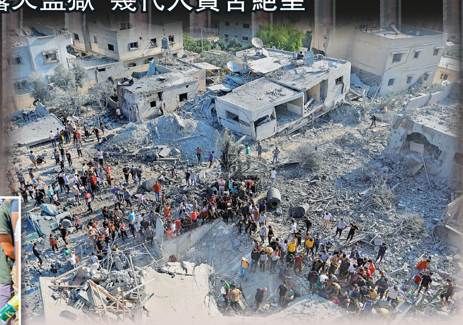
以色列14日繼續空襲加沙地帶，留下滿目瘡痍。