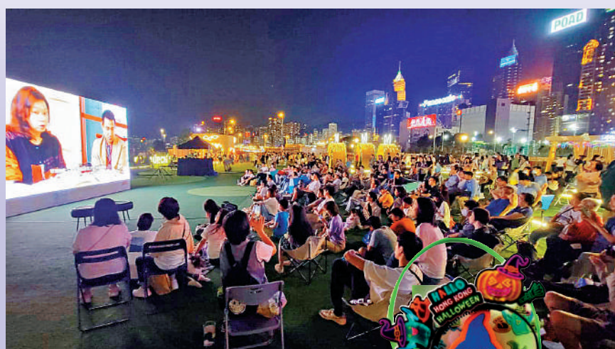
▲灣仔海濱首次舉行電影放映活動，令「夜繽紛」活動更加熱鬧。

【大公報訊】萬聖節將至，香港旅遊發展局昨日起推出「哈囉威香港」，陸續在旅客諮詢中心、港鐵車站、觀光交通工具及全城多個熱點，添上玩味十足的萬聖節主題裝飾，並推介四大吸晴好去處，邀請旅客及市民一起打卡。