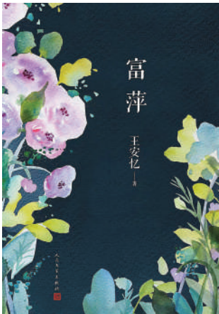
▲《富萍》，王安憶著，人民文學出版社。