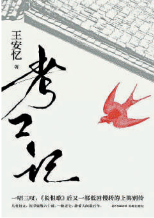
▲《考工記》，王安憶著，花城出版社。