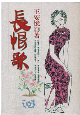
▲《長恨歌》繁體版，王安憶著，麥田出版。