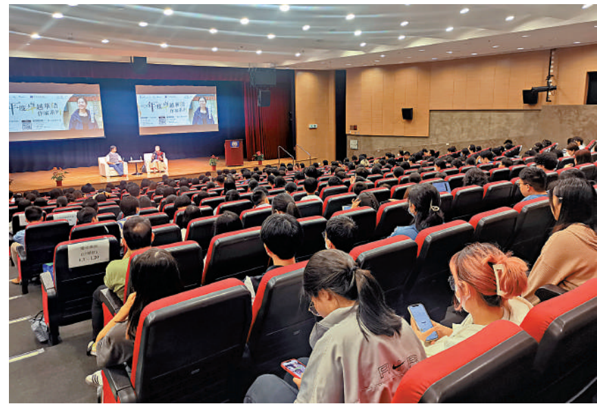
▲王安憶在講座現場與學子們分享寫作心得。

雖說並非當時時代的親歷者，但她堅持書中人與事「人盡其能，物盡其用」，人物不可設置太多，如此就會太分散。既然有歷史原型，很難再超越，只得對現有素材盡可能啟用。