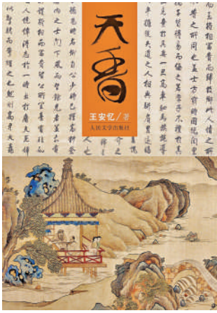
▲王安憶作品《天香》講述刺繡工藝的故事。