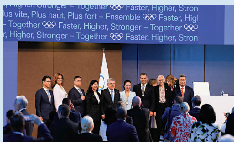
▲國際奧委會主席巴赫（後排左五）與新任國際奧委會委員合影。