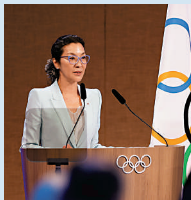
◀楊紫瓊在國際奧委會第141次全會上發言。