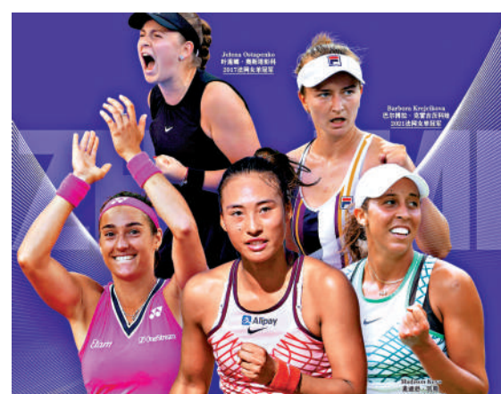
◀珠海WTA超級精英賽首批參賽名單公布。

2017法網女單冠軍奧絲達賓高將參賽。姬捷高娃最高排名第二，擁有七座巡迴賽單打冠軍頭銜、女雙全滿貫得主。奧絲達賓最高排名第五，擁有六座巡迴賽單打冠軍頭銜。2017美網女單亞軍姬絲也將「加盟」，她最高排名第七，擁有七座單打巡迴賽冠軍頭銜，也是她第四次亮相珠海WTA超級精英賽。2022WTA年終總決賽女雙冠軍古迪美杜娃、2022WTA年終總決賽女單冠軍加西亞也將參賽。