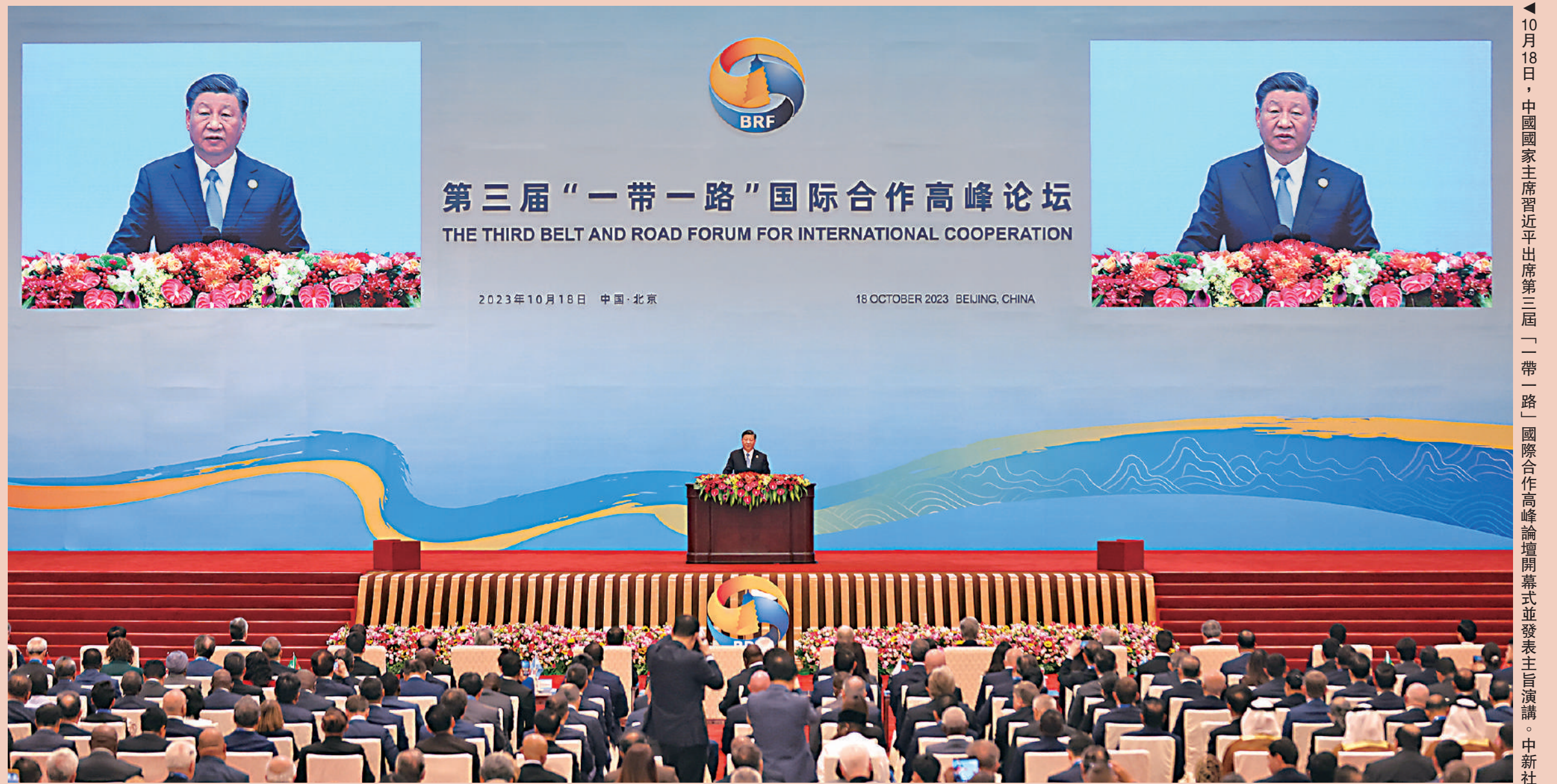
◀10月18日，中國國家主席習近平出席第三屆「一帶一路」國際合作高峰論壇開幕式並發表主旨演講。

習近平主旨演講摘要 人類是相互依存的命運共同體。世界好，中國才會好；中國好，世界會更好。 古絲綢之路之所以名垂青史，靠的不是戰馬和長矛，而是駝隊和善意；不是堅船和利炮，而是寶船和友誼。 10年的歷程證明，共建「一帶一路」站在了歷史正確一邊，符合時代進步的邏輯，走的是人間正道。 我們追求的不是中國獨善其身的現代化，而是期待同廣大發展中國家在內的各國一道，共同實現現代化。世界現代化應該是和平發展的現代化、互利合作的現代化、共同繁榮的現代化。 資料來源：央視新聞