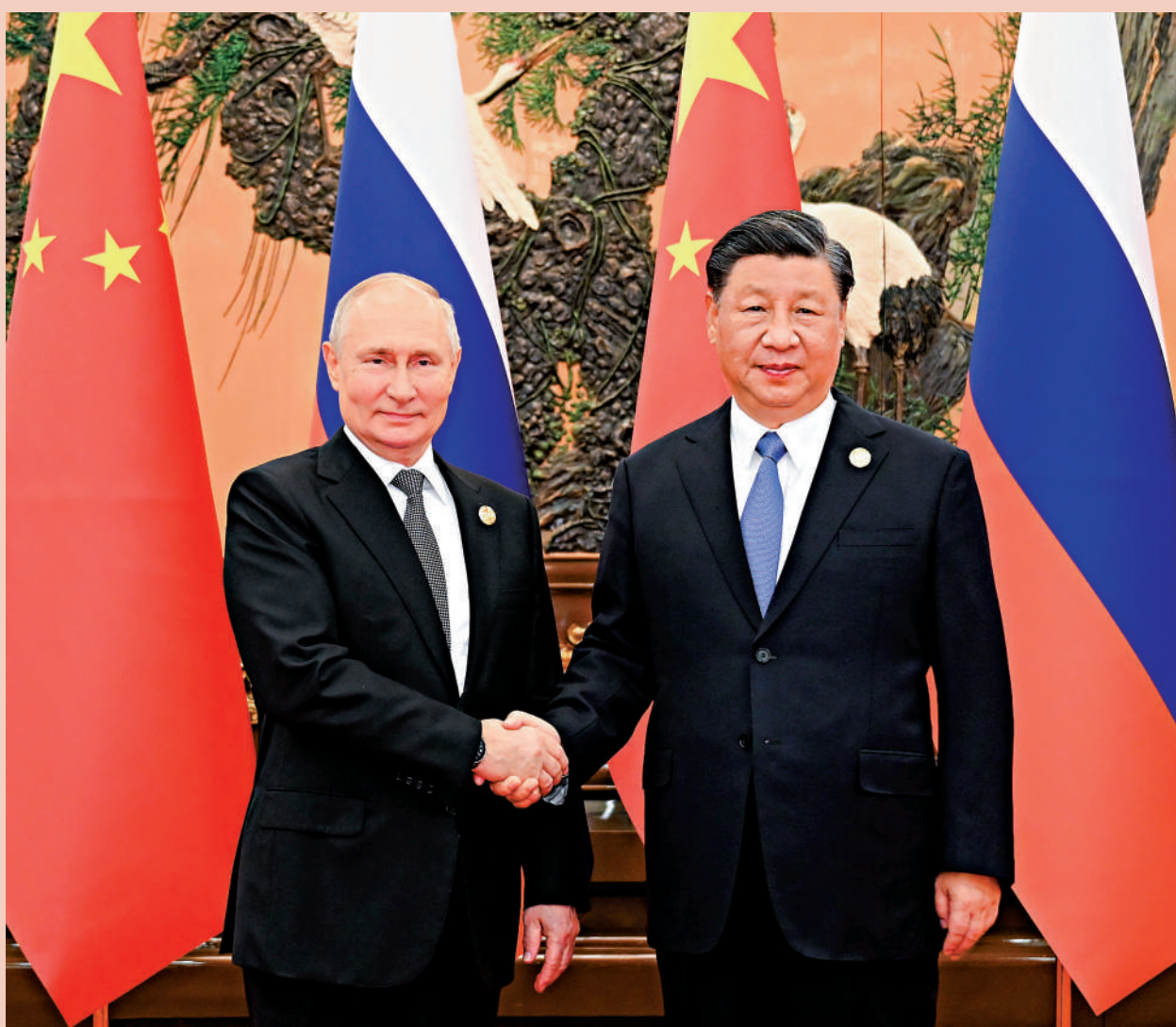
▲10月18日中午，國家主席習近平在北京人民大會堂同來華出席第三屆「一帶一路」國際合作高峰論壇的俄羅斯總統普京舉行會談。