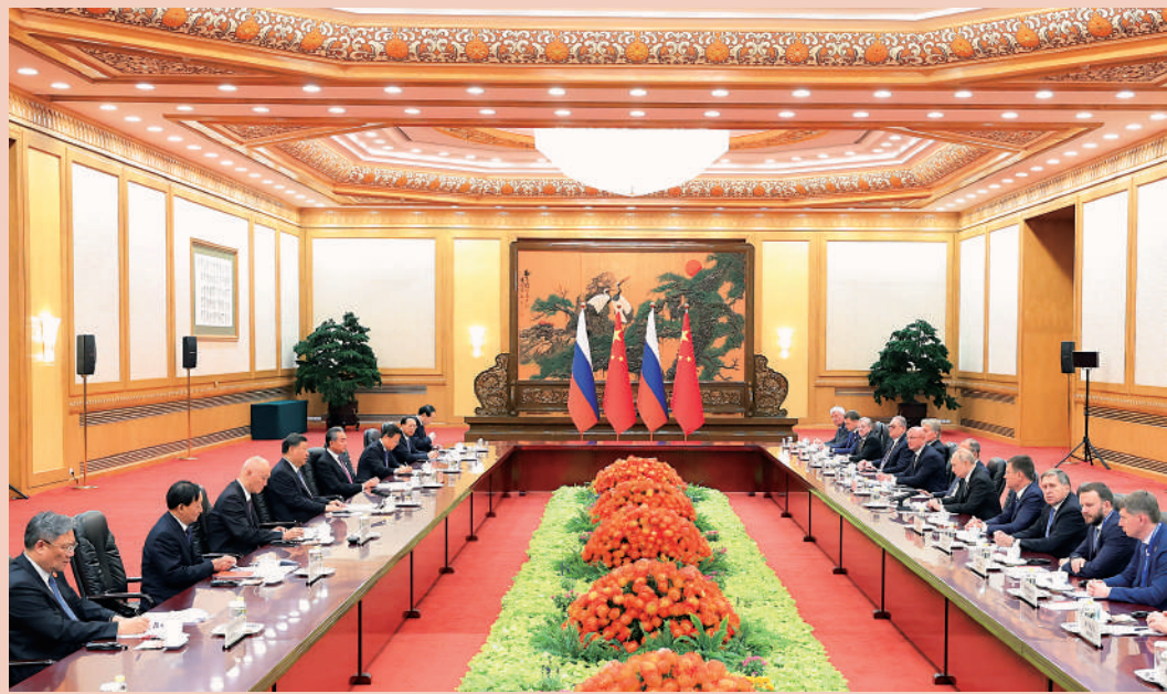
▲10月18日中午，國家主席習近平在北京人民大會堂同俄羅斯總統普京舉行會談。