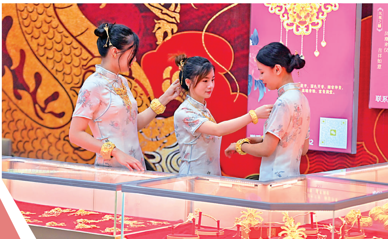
▲10月18日，國家統計局公布，前三季度國內生產總值913027億元人民幣，同比增長5.2%。圖為18日，參展商在廣西賀州舉辦的首屆黃金珠寶展上展示黃金飾品。