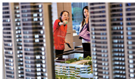
▲山西太原一售樓部內，銷售人員為客戶講解商品房戶型。

他並表示，從去年到今年，內地出台了一系列穩定房地產的優化政策，但政策的發揮還要有個過程，「房地產總體上處在一個調整階段，所以後期還是要抓好政策的落實」。