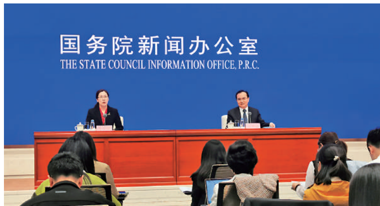
▶盛來運（右）在國新辦介紹前三季度國民經濟運行情況。

分季度看，一季度GDP同比增長4.5%，二季度增長6.3%，三季度增長4.9%。盛來運分析，三季度增長比二季度同比增速回落，主要是因為去年對比基數抬升的原因。去年二季度是內地疫情衝擊比較嚴重的一個季度，當季GDP同比增速只有0.4%。若從環比增速來講，今年三季度增長1.3%，比二季度加快0.8個百分點，增長仍持續恢復向好。無論是同比增速還是前三季度的累計增速，在國際主要經濟體中都是名列前茅。