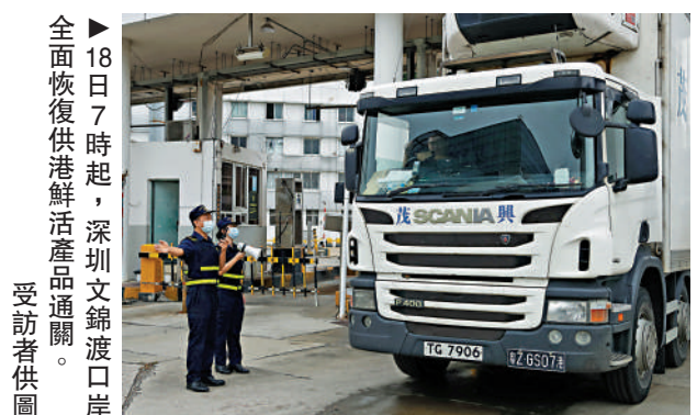
▶18日7時起，深圳文錦渡口岸全面恢復供港鮮活產品通關。

文錦渡口岸作為供港鮮活產品去往香港的主要通道，被深港兩地市民稱為供港「綠色生命線」，據海關統計，今年以來，文錦渡海關累計監管供港鮮活產品約101萬噸。