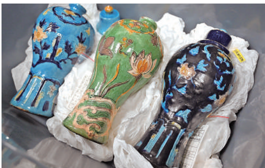
▲從南海沉船遺址提取出的部分文物。

在漆黑的南海1500米深海底，多處疑似被船艙分隔開的數以萬計的陶瓷器物散落在海床表面。在距其10餘海里處，一處沉船散落大量原木……2022年10月，「深海勇士」號的測深側掃聲吶傳回了清晰圖像，經海水冲刷的歷史遺跡出現在人們眼前，位於南海西北陸坡約1500米深度海底的兩艘古代沉船遺址被發現。國家文物局表示，這一重大發現充分展示了中國深海科技與水下考古跨界融合、相互促進的美好前景，標誌着中國深海考古達到世界先進水平。