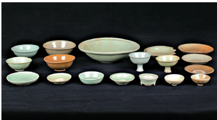
▲漳州聖盃嶼元代沉船遺址出水龍泉青瓷。

盃嶼元代沉船遺址位於福建省漳州市古雷港經濟開發區古雷半島東側聖盃嶼海域。沉船遺址水深約30米，主體區域殘存有木質船體和成摞擺放的船貨堆