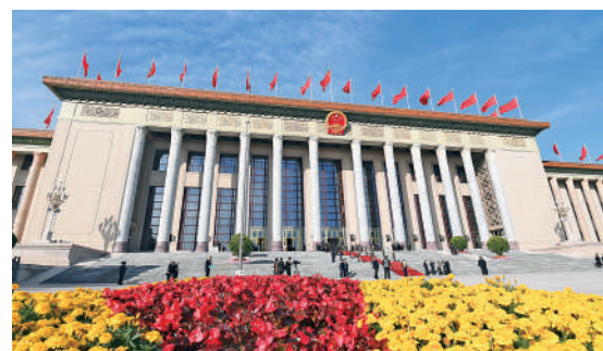
▲10月18日，第三屆「一帶一路」國際合作高峰論壇開幕式在北京人民大會堂舉行。

馬威中國及亞太區主席陶匡淳說。「世界現代化應該是和平發展的現代化、互利合作的現代化、共同繁榮的現代化」「我們追求的現代化、共同繁榮的現代化，而是期待同廣大發展中國家在內的各國一道，共同實現現代化」——習近平主席的話擲地有聲，讓不少來自發展中國家的嘉賓倍感振奮。