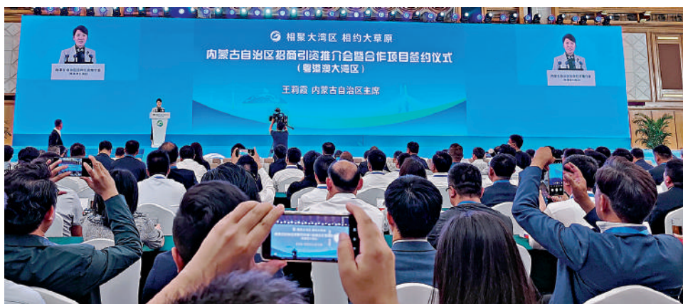
▲內蒙古自治區招商引資推介會暨合作項目簽約儀式現場。

高效光伏、綠電「氫氨醇」等應用場景創新，和一系列重大裝備、技術、材料的創新與融合示範，在內蒙古培育集研發實驗、高端製造、運營服務、裝備出口為一體的綠色經濟增長極。