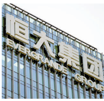
▲恒大公布，三個境外債重組聆訊無限期延期及取消。

公司又指出根據美國法典第15章，向紐約南區美國破產法院申請承認香港及英屬維爾京群島(BVI)法律體系下的境外債務重組協議安排，原計劃於下周三(25日)由紐約南區美國破產法院審理的聆訊將延期。