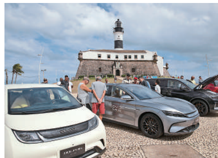
▲7月4日，參觀者在巴西巴伊亞州首府薩爾瓦多觀看比亞迪純電動汽車。

習近平強調，今年是中巴建立戰略夥伴關係30周年，明年將迎來建交50周年，兩國關係繼往開來，大有可為。巴西國會是中巴關係發展的重要推動力量，希望眾議長先生和各位議