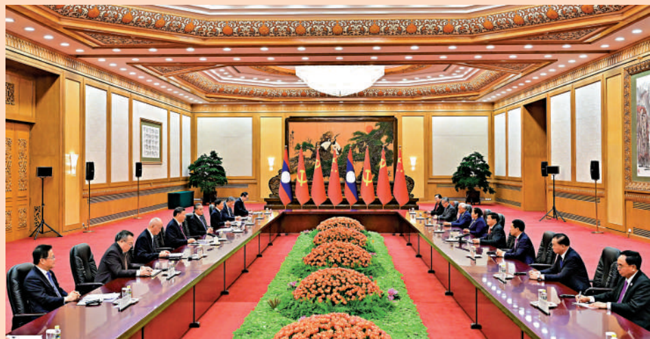
▲10月20日上午，中共中央總書記、國家主席習近平在北京人民大會堂會見來華出席第三屆「一帶一路」國際合作高峰論壇並進行工作訪問的老撾人民革命黨中央總書記、國家主席通倫。