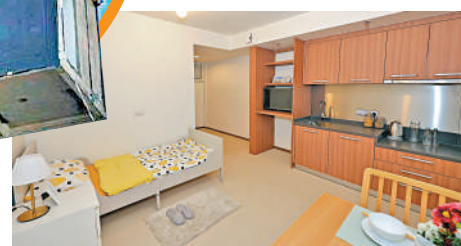
▲松悅樓的長者單位大門設高低雙防盜眼、全屋低門檻，並有圓角矮身廚櫃、抽油煙機和電熱水爐等基本設施。