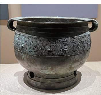
▲獸面紋銅簋。盤龍城出土的青銅簋是目前發現最早的商代青銅簋。

與先進的烹飪手法。根據考古發現，盤龍城先民的飲食表現為「其谷宜稻」兼食粟粟的主食體系，副食則有豐富的瓜果蔬菜，肉食來源包括水產類、家畜及野味，且當時的人們已經熟練運用煎、蒸、煮、炙等多種烹飪手法，與今天相比也是毫不遜色。