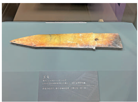
▲大玉戈，既是祭祀禮儀用品，也是神權與軍事指揮權的象徵。

鬲是炊煮器。與同是炊煮器的鼎相比，鼎可以明顯的分為腹身與足兩部分，鬲的腹部與足部則不好分開，而中空的足部可以擴大受火面積，便於較快地煮熟食物。展覽現場展出有弦紋銅鬲。