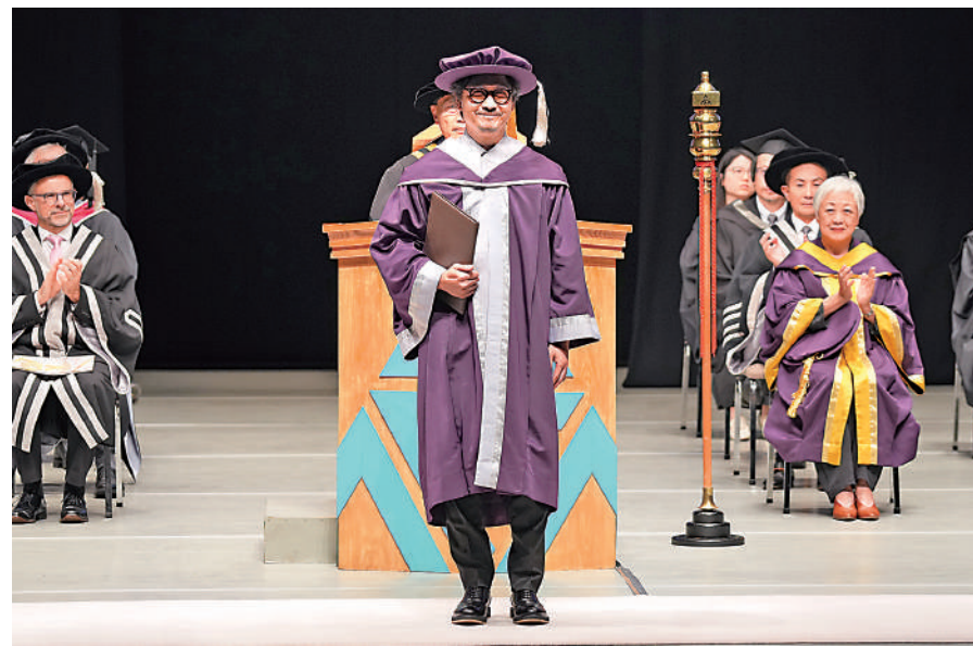
▲謝君豪（前）獲頒香港演藝學院榮譽院士。資料圖片

【大公報訊】記者溫穎芝報道：早前勇奪「華語戲劇盛典」舞台劇最佳男主角的謝君豪，再獲香港演藝學院頒授榮譽院士。同獲頒榮譽院士的亦包括資深影評人羅卡。