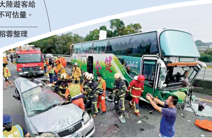
▲21日，台灣第三號高速公路南下雲林段發生重大車禍，造成4死22傷。