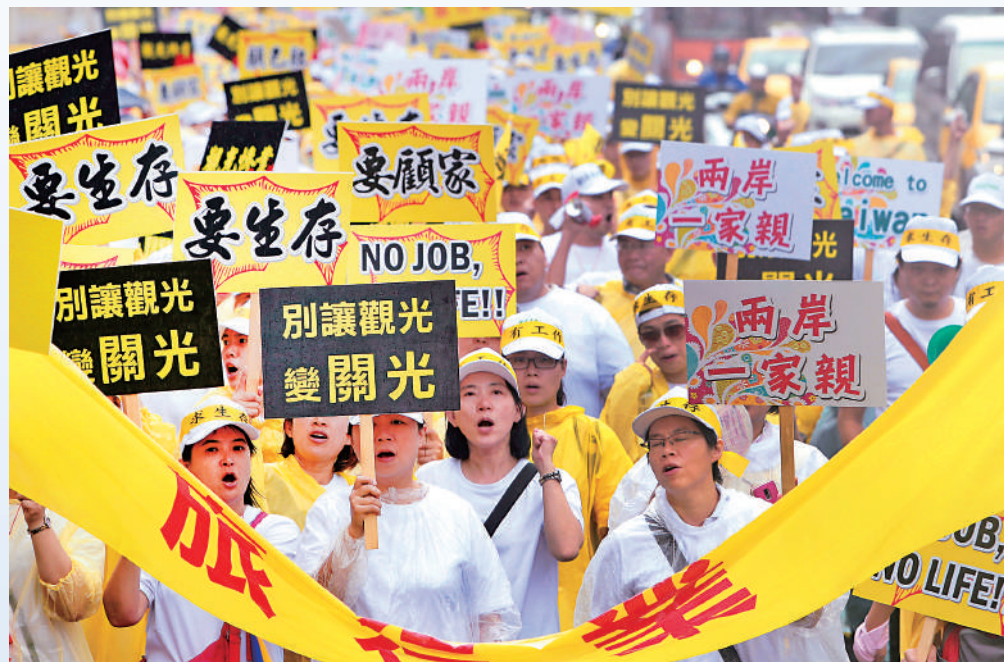
▲台當局日前稱大陸遊客今年都不會來台，引發島內旅遊業者不滿。圖為觀光業者上街抗議表達訴求。資料圖片