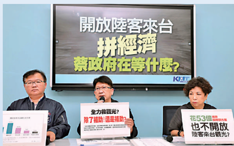
▲國民黨在今年5月召開記者會，批評民進黨意識形態作祟，阻擋兩岸旅遊業重啟。