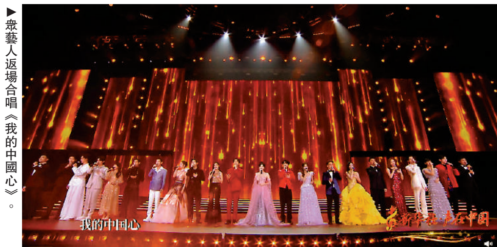
▲眾藝人返場合唱《我的中國心》。