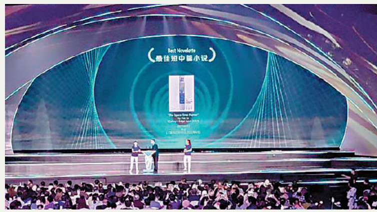
▲中國作家海漣的作品《時空畫師》獲雨果獎「最佳中篇小說」獎。

此前曾經獲得過雨果獎的中國作家科幻作品包括劉慈欣的《三體》和郝景芳的《北京摺疊》。