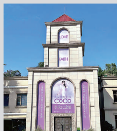
▲墓園為李玟設置專屬紀念園區。

2022年7月30日，第36屆大眾電影百花獎在武漢舉行開幕式，登上紅毯的李玟向觀眾開心大喊：「我是武漢姑娘啦！武漢姑娘回家啦！」這也是李玟生前最後一次回武漢。