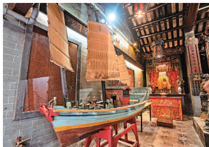
▲西貢佛堂門天后古廟。

【大公報訊】政府近日刊憲，公布古物事務監督（即發展局局長）根據《古物及古蹟條例》將位於西貢的佛堂門天后古廟（古廟）和上環的香港中華基督教青年會列為法定古蹟。