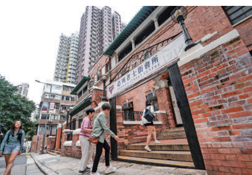
▲市民走進上環的必列者士街會所參觀。

香港中華基督教青年會現稱必列者士街會所，位於上環必列者士街，建於1918年，是香港中華基督教青年會首幢總部大樓，直至該會於1966年把總部遷往九龍窩打老道為止。大樓至今仍保留本港首個室內暖水泳池和以懸臂式結構支撐的木製鑊形跑道。自大樓啟用以來，香港中華基督教青年會一直在該處提供各式各樣的社會服務，見證香港社會服務發展。1927年訪港的魯迅先生曾在此進行過兩場演講。現時該會在大樓提供弱能人士復康服務和其他社會服務。