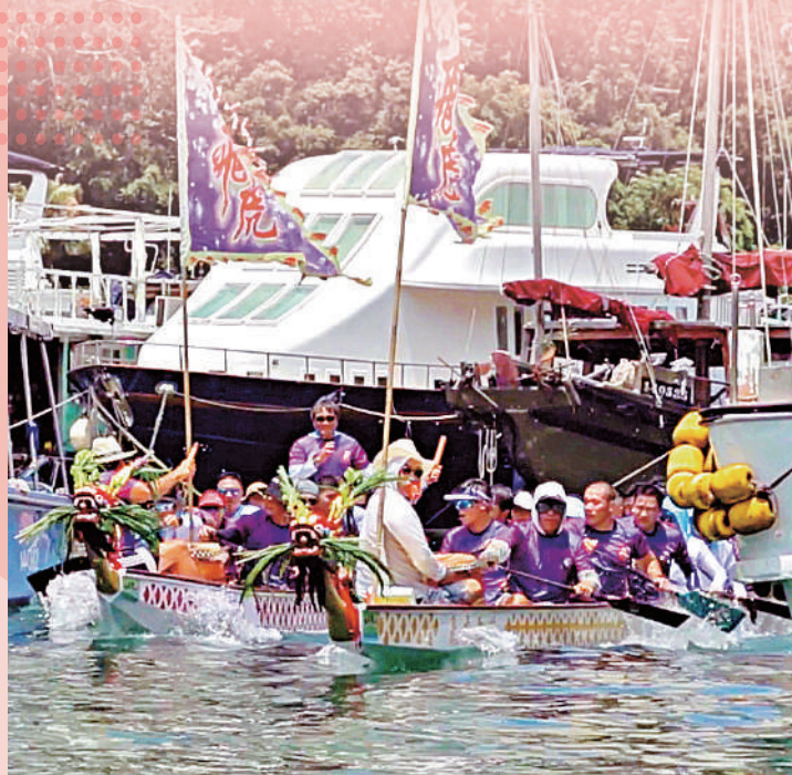
▲龍舟拜廟活動是漁民的傳統文化，隨着漁民已陸續上岸，這習俗已漸被遺忘。