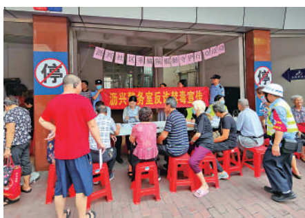
▲佛山南海區長者登記領取銀齡守護卡設備。

用手機進行評價驗收。2021年以來，香洲區搭建「珠海市香洲區居家智慧養老服務平台和中心」，依託珠海市智慧養老服務平台建設，形成信息互通、實時監管、