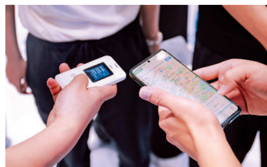
◀使用者測試守護卡的實時定位功能。