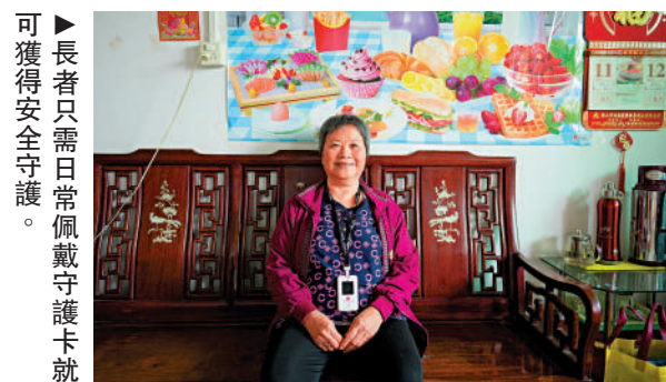
▶長者只需日常佩戴守護卡就可獲得安全守護。