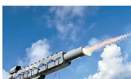
▲日本防衛裝備廳17日公開的軌道炮海上試射畫面。

日本研製電磁軌道炮的目的是防禦周邊鄰國高超音速武器，計劃優先配備於「摩耶」級驅逐艦上，用於打擊高超音速導彈、戰機等目標，增強防空反導攔截體系，並將進一步開發陸基版本。