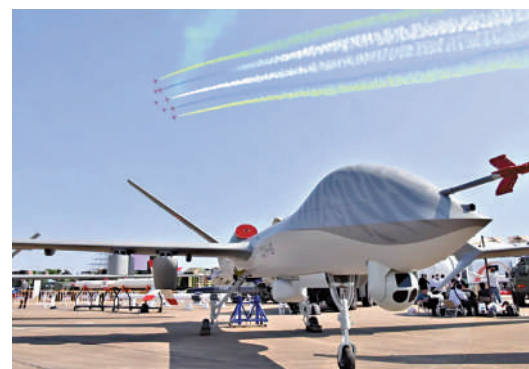
▲去年珠海航展期間首次展示了容納聲吶吊艙的彩虹-5。

彩虹-5是察打一體無人機，翼展長達22米，最大起飛重量達3.3噸，滯空續航時間超35小時，擁有強大的任務載荷集成能力。6個外掛架可掛載各種類型精確制導導彈。因此，具有搜潛功能的彩虹-5可根據需要掛載魚雷或深彈，實施攻潛作戰，並與空潛-200反潛巡邏機、直-20F反潛直升機協作，形成更為嚴密的空中獵潛網。