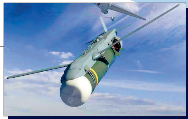
▲美國波音在研的HAAWC套件將反潛魚雷升級為精確滑翔武器。圖為其模擬圖。