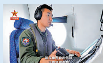
▲巡邏機人員在設置武器參數。