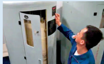
▲巡邏機人員在操作聲吶浮標投放器。