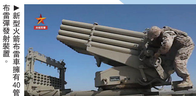
▲新疆軍區某合成團工兵分隊日前在大漠戈壁進行火箭布雷車遠程布雷實彈射擊。偵察班首先施放四旋翼無人機，迅速前出抵達預定目標區域，從空中對地形進行立體化偵察，並將信息回傳控制終端。

布雷組根據目標區域坐標，計算射擊諸元，裝填彈藥，調整高度和方向，完成布雷準備。而後，連續發射多枚火箭布雷彈，在10公里外的目標區域構設縱深混合雷場。