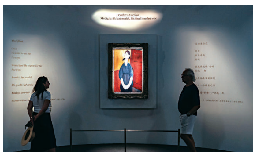
▲蘇富比於本月初在港舉行秋季拍賣會，其中一幅畫作《寶麗特·茹丹肖像》以當日最高成交價的2.7億港元易手。