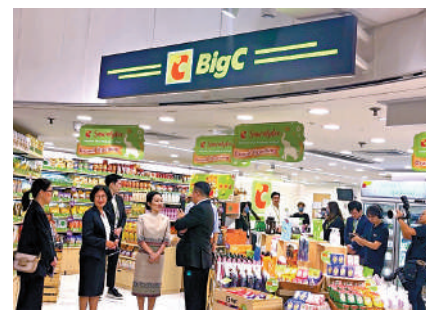
▲泰國連鎖超級市場Big C進駐本港。

早於去年5月首度登陸香港的日資連鎖藥妝品牌松本清，一直未有減慢香港業務的拓展步伐，該品牌迄今在