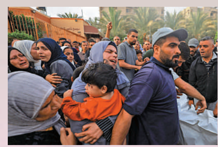
▲加沙民眾22日看見家屬的屍體後悲痛不已。

家帶口乘坐汽車、卡車，甚至驢拉車，攜帶自己全部家當倉促遷往加沙南部。紅十字國際委員會通訊官員姆哈納稱，自己「親眼見到」許多婦孺及長者步行數十里，試圖抵達安全區域。在捱過