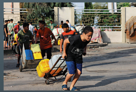
▲以色列切斷了加沙水源，民眾22日在拉法運送水。

民眾唯一的天然水源是沿海含水層盆地（Coastal Aquifer Basin），但這裏也面臨包括過度開發，海水倒灌及污水滲透等問題。這裏的水源含鹽度過高，96%不適合人類飲用。