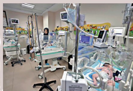
▲加沙醫院內的護士22日在照顧新生兒。

在保溫箱中，其中70名新生兒需要設備協助呼吸。如果機械通風培養箱的電源被切斷，嬰兒的生命將受到巨大威脅。