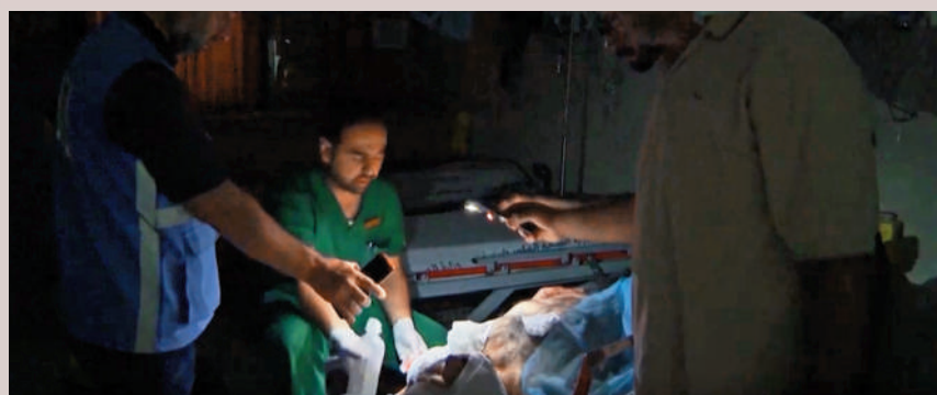
▲加沙斷電導致醫生在黑暗中借助手機手電筒照明。