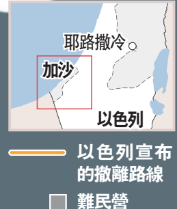
加沙居民南遷路線圖