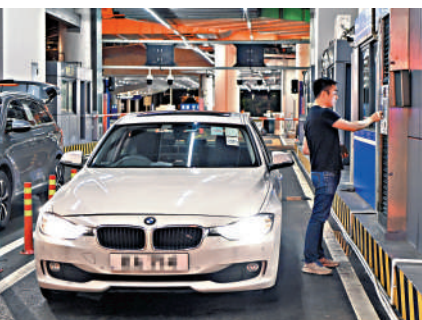
▲香港車主在港珠澳大橋珠海公路口岸辦理入境手續。

岸等部門獲悉，接下來港珠澳大橋可望推行及落實新通行措施。其中，已經在橫琴口岸試點推行的「常旅客」計劃，可望在條件成熟時逐步擴至港珠澳大橋口岸，進一步方便三地人員交流往返。同時，將視乎旅遊開發的條件成熟程度，擬放寬大橋限定區域的管理，讓更多社會車輛「上島上橋」。