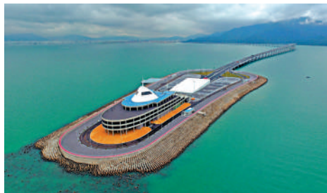
▲港珠澳大橋推進東人工島開發，助旅遊開發。新華社