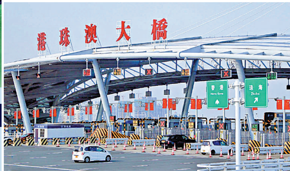
▲通車五年來，港珠澳大橋見證三地人民頻繁往來，口岸的客流、車流不斷刷新歷史紀錄，交出亮眼「成績單」。