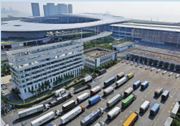
▲貨車在港珠澳大橋珠海公路口岸候檢。