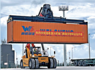
▲工作人員駕駛工程車在港珠澳大橋澳門跨境貨物轉運站忙碌。

• 包括飛機發動機、黃金首飾、集成電路、新能源汽車等，高價值、高技術、高附加值產品成為大橋口岸主要進出口商品，進出貨車量穩步增長，已達到每天2000輛次。