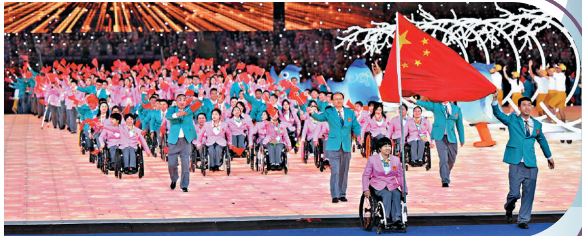
▲中國代表團在開幕式上入場。