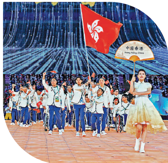
▲中國香港代表團入場。新華社