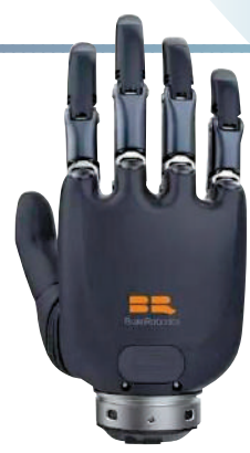
▲智能仿生手能不斷學習、進化。

下一步想做什麼。也就是說，能「感知」人類大腦的想法，從而幫助人類實現用意識控制手臂動作。仿生手更「神奇」的還在於，能不斷學習、進化，更快、更精確地了解佩戴者的想法。