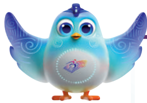
▲開幕式以「心相約 夢閃耀」為主題。