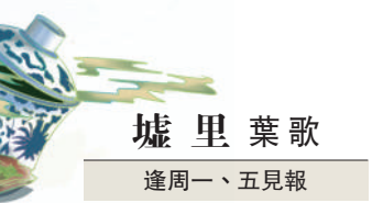
墟里葉歌 逢周一、五見報