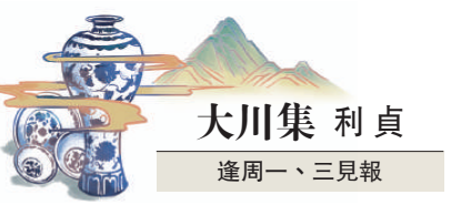
大川集 利貞 逢周一、三見報

閱讀是一種奢侈，它所需求的是時間的投入和心靈的專注，而奢侈的回報，定然超乎想像。