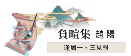
負喧集 趙陽 逢周一、三見報

這些「街」與「道」，無一不來自英格蘭的郡名或是地方名。歌和老街、律倫街、牛津道，有那麼一個瞬間，我疑心自己穿行在英倫的小鎮裏。唯一例外的是何東道。以中國人身份為傲的慈善家何東，在花園城市工程面臨爛尾時出手協助，在業主們的強烈請求之下，區內原本全以英國郡為名的街道，選取一條命名為何東道，這樣的文化底色，無疑更持久動人。