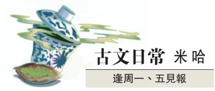
古文日常 米哈 逢周一、五見報

換言之，韓愈認為老子不是想毀謗仁義，只是他見識淺短，坐井觀天，看不見真正的仁義之大，只見小恩小惠是仁、小善小行為義，於是看不起仁義。但，這跟我們要談的生活學，又有什麼關係呢？說來話長，我們下回繼續。