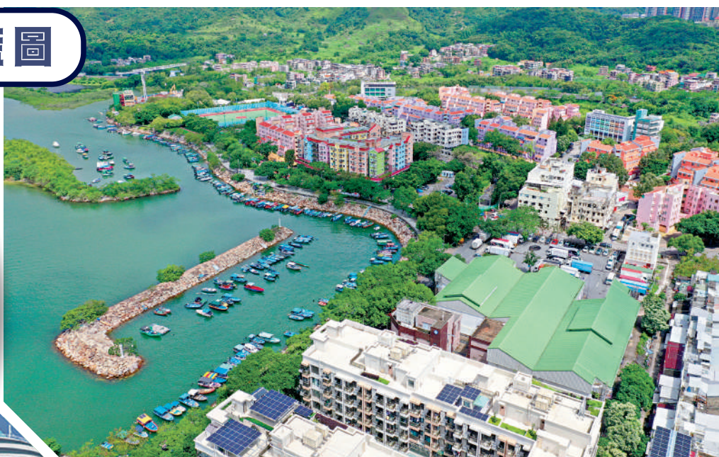
▲施政報告提出建設沙頭角文化旅遊區，將由明年一月起逐步開放沙頭角禁區（不包括中英街）。