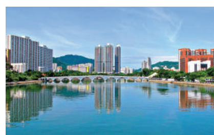
▲政府將會推行「悅目亮麗城市計劃」，重點打造城門河（左）及元朗明渠（右）成為賞花熱點。

另外，環境及生態局今年底將與業界推出《漁農業可持續發展藍圖》，優先推展項目包括引入「現耕現賣」概念，在合適的公眾街市天台設置現代化水耕農場暨攤檔，興建中的天水圍公眾街市將率先落實。而為