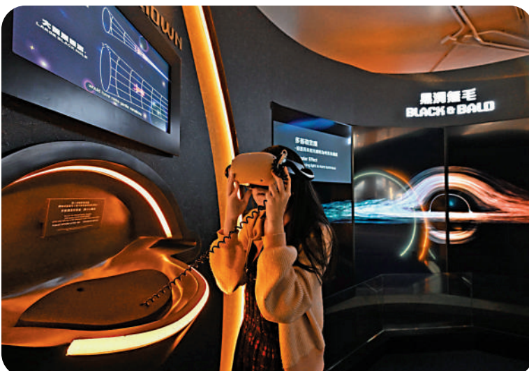
▲「黑洞——信息的盡頭」展覽設有虛擬實景眼鏡，模擬掉進黑洞的過程。

目前，廣州正大力推動「詩詞之都」，通過高水平的活動，不斷培育市民的創作熱情，使花城充滿詩意。香港公共圖書館自一九九一年開始舉辦「全港詩詞創作比賽」，到今年已是第三十三屆。我讀遍所有獲獎作品，尤喜其中一首七律《春遊沙田萬佛寺》的兩句：「頭陀望裏香城小，山客談中禪意深。」溫醇古雅，逸興盎然。且讓穗港詩詞人共同唱和，譜出更多古典形式的詩詞，繼承和豐富中華文化。