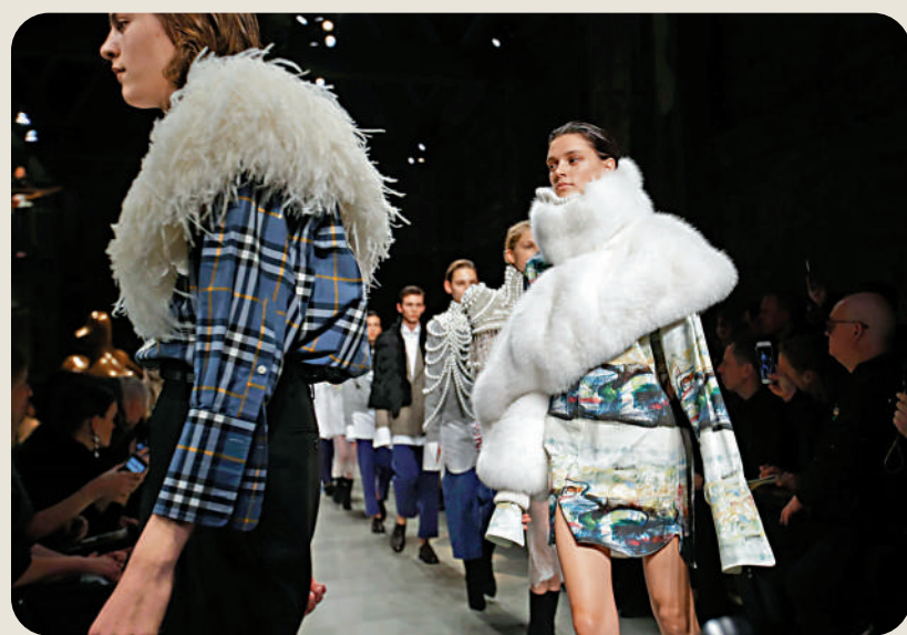
▲皮草曾是不少時尚品牌的主打元素。 資料圖片

型文化活動中已是屢見不鮮。像是去年「停止石油」活動的抗議者，向英國國家美術館中的梵高名畫《向日葵》潑番茄湯，以及今年美國網球公開賽半決賽上，「終結化石燃料」的氣候抗議者衝進賽場，將自己的腳貼在地板上，都是藉此表達對石油企業擔任贊助商的不滿。不過，倫敦時裝周尤其成為眾矢之的，是因為時裝行業從虐待動物到破壞環境再到人類傷害，提供了太多可以抗議的內容，那尖叫的山羊和假葬禮等表演，都不過是眾多反對聲音的冰山一角。