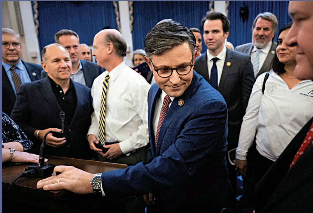
▲路易斯安那州眾議員約翰遜（中）24日被共和黨提名為議長候選人。