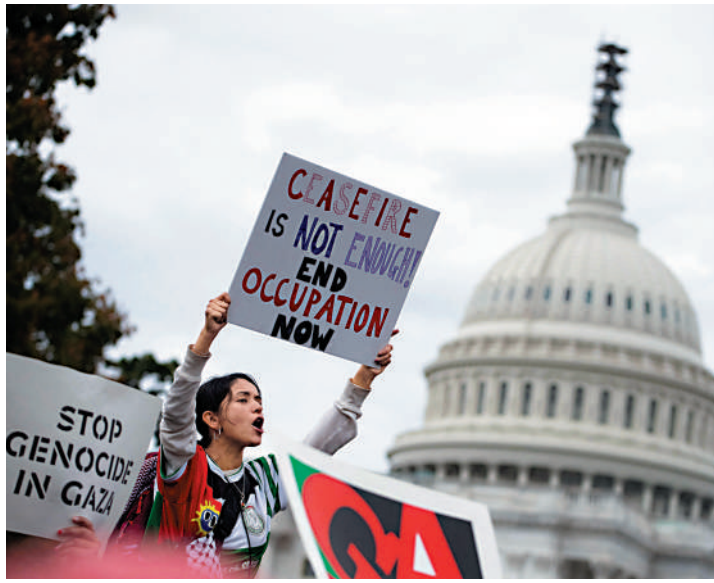
▲美國眾議院癱瘓，關於巴以衝突的法案得不到及時處理。圖為美國猶太人團體18日在國會附近示威。

【大公報訊】綜合《紐約時報》、《華盛頓郵報》、路透社報道：美國國會眾議院已連續三週選不出議長。24日，共和黨提名的第三位候選人湯姆·埃默斯堅持了幾個小時就宣布退選，第四位候選人邁克·約翰遜被推到台前。共和黨內部人士承認，這場沒完沒了的鬧劇令共和黨更加撕裂，「很難相信任何人在這種情況下順利當選。」《紐約時報》指出，共和黨並不避諱黨內四分五裂的事實，甚至引用曾在紐約橫行霸道的五大黑手黨家族的名號，將黨內主要派系稱為「五大家族」。