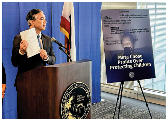
加州總檢察長邦塔24日介紹數十州共同起訴Meta的情況。

早在2021年，美媒已揭露Meta對未成年人身心健康造成負面影響。《華爾街日報》援引Meta的內部研究指出，該公司知道使用Instagram可能危害青少年，尤其是少女的心理健康。在十幾歲女孩群體中，13.5%表示Instagram加劇了自殺的想法，17%說該平台導致飲食障礙問題惡化。