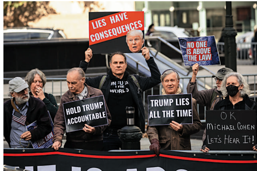
▲特朗普24日在紐約出庭，反對特朗普的示威者在法庭外抗議。

特朗普否認在佐治亞州案件及其他三宗刑事案件中有不當行為，並聲稱針對他的指控是民主黨發起的「政治迫害」。