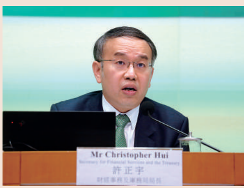
▲財經事務及庫務局局長許正宇表示，促進股票市場流動性專責小組已提交報告，行政長官已接納小組建議。

財經事務及庫務局局長許正宇表示，促進股票市場流動性專責小組已提交報告，行政長官李