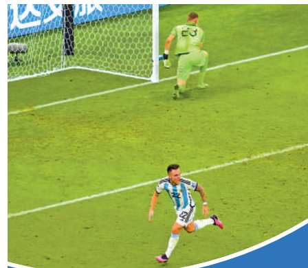
▲國際足聯曾考慮2026年世盃分組賽引入打和射12碼的賽制。

2026年世界盃由美國、加拿大和墨西哥聯合主辦，當中美國除NBA外，NHL（冰球）等項目也沒有打和，上述建議並非無可能。