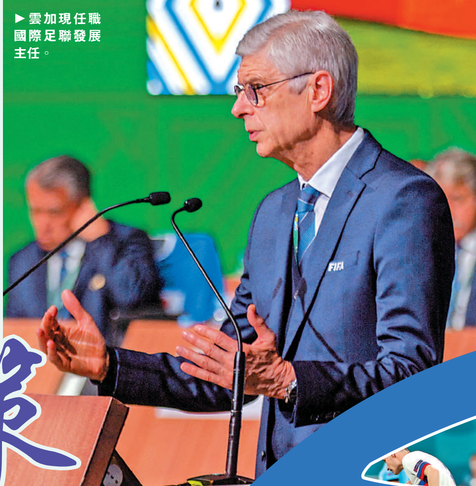
►雲加現任職國際足聯發展主任。