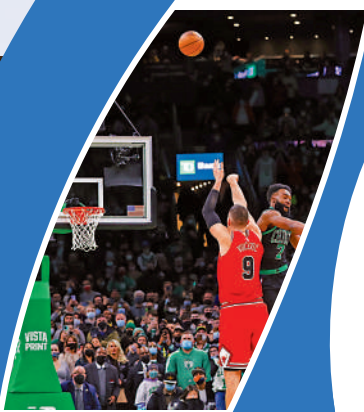
▲雲加提議仿效NBA做法，同步停頓計時器。

最佳例子是球員在半場線附近阻止對手進攻而犯規，球證多不會發紅牌，但黃牌又略嫌不足，橙牌相對便更適合。