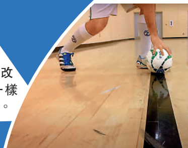
►雲加建議改變傳統用手擲界外球（下圖），改為與5人足球一樣用腳踢（上圖）。

就此雲加微調有關建議，表示只會在獲取界外球一方的自己後半場才實行用腳踢，若在前半場則維持現行規例。其實國際足聯亦曾於30年前在比利時、匈牙利等地作試驗唯一般反應負面，且看現世代的足球又是否適合。