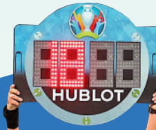
◀雲加認為應設倒數計時器，避免浪費比賽時間。