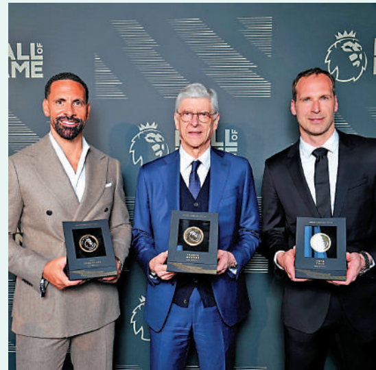
▲雲加（中）今年入選英超名人堂。 網絡圖片