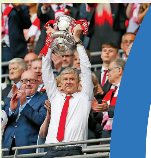
▲雲加（舉盃者）任阿仙奴主帥時奪得不少錦標，圖為贏得2017年足總盃。