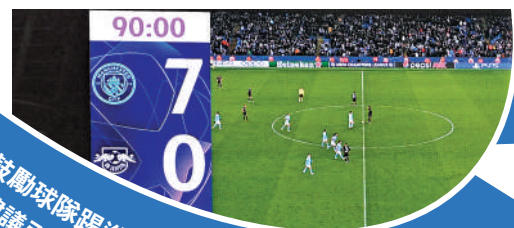
▲雲加鼓勵球隊踢進攻足球，建議引入入球「獎賞分」。

以上季英超為例，曼城與利物浦鬥至煞科日，前者才以1分險勝，但若加入獎賞分制，曼、利分別得7分和3分，減低了門到最後的吸引力。