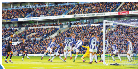
▲雲加建議比賽中的自由球，可以自己傳給自己加快比賽節奏。

反對者覺得修訂屬多此一舉，皆因只要隊友上前輕輕把自由球開給欲帶球者便可，但由後者「自給自」畢竟更為直接，所費時間亦較短，細節上有所不同。