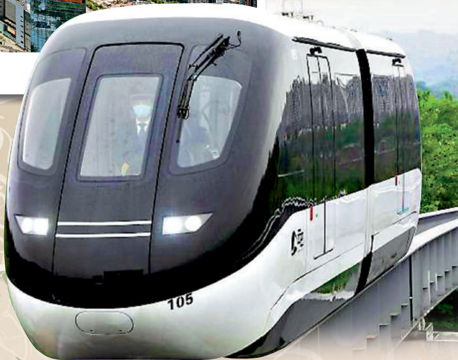
▲啟德居民認為，將興建的集體運輸系統採用「雲巴」較適合。