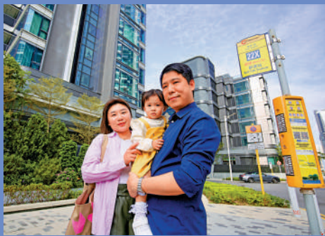
▲歐先生希望新運輸系統可以在住宅區的中心和跑道公園各設車站。