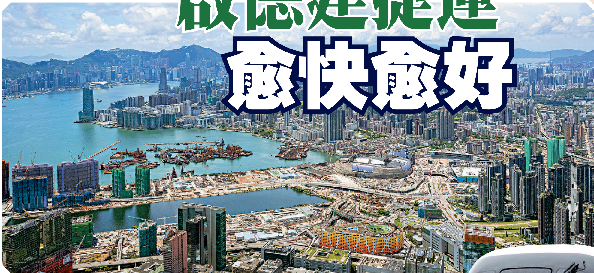
啟德新集體運輸系統預計走線

啟德跑道區的交通配套嚴重不足，居民長期深受困擾，乘搭巴士到最近的啟德地鐵站，車程只需約7分鐘，但等車卻花30分鐘。最新公布的施政報告為解決這個問題帶來希望。行政長官宣布興建三個智慧綠色集體運輸系統，當中包括連接啟德跑道區至啟德地鐵站，方便居民出行，而且可配合啟德郵輪碼頭的旅客交通需要。