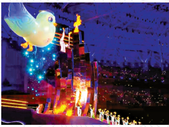
▲開幕式上，最後一棒火炬手戴上智能仿生手與吉祥「飛飛」合作點燃主火炬。

【大公報訊】杭州亞殘運閉幕式今晚（28日）7時30分舉行，閉幕式總導演沙曉嵐、總撰稿人呂媛在媒體吹風會上，介紹閉幕式主題特色，其中劇透了主火炬熄滅環節，將以前所未有的獨特方式上演。