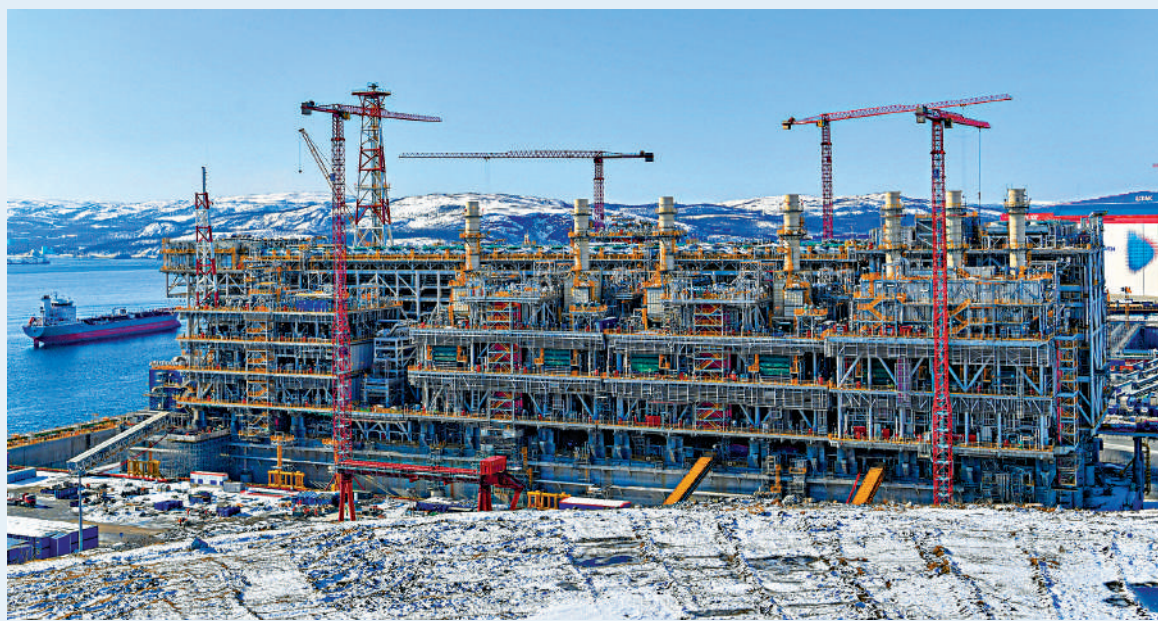
▲「冰上絲綢之路」建設熱度增強。圖為俄羅斯摩爾曼斯克拍攝的浮動重力式平台。

國家主席習近平近日在第三屆「一帶一路」國際合作高峰論壇開幕式上發表主旨演講，宣布中國支持高質量共建「一帶一路」的八項行動，當中包括構建「一帶一路」立體互聯互通網絡，加快陸海新通道建設的目標。為實現該目標，中國進一步與俄羅斯聯合打造「冰上絲綢之路」，構建中國途經北冰洋通往歐洲的北極航道，以此擴大中俄和歐洲國家的文化、經貿、旅遊等方面的交流與合作，還將重塑國際能源格局，推動世界經濟中心北移，以及培育國際合作共生、共贏新機制。