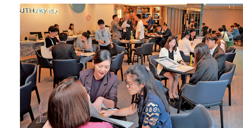
▲多個新盤於施政報告「減辣」後登場，一手新盤市場勢必轉趨熱鬧。

早前新盤市場減慢，稍後發展商亦需要「追數」，相信「驚喜價」推盤情況或會增加。發展商加快推盤，務求「貨如輪轉」，而早前金管局已放寬按揭保險計劃至樓花物業，有助樓花銷售，整體一、二手交投勢必回升。