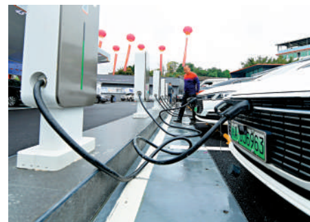
▲專家認為，新能源塊板今季表現看高一線。

巴以衝突雖然仍在繼續，但中東其他國家尚未做好參戰準備，從各國最新的表態來看，參戰意願也不高，因此在中短期內演化成第六次中東戰爭的概率很低。