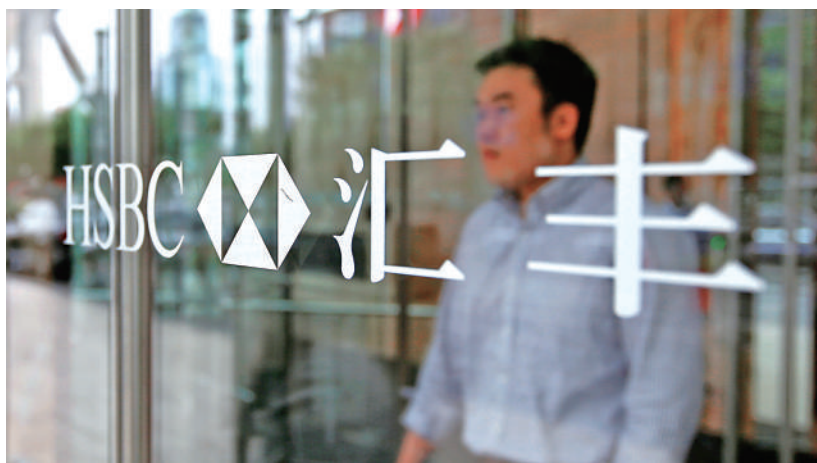
滙豐控股股價持續提升中國業務比重，股價有望繼續跑贏大市。

不過，近年持續加碼投資中國的滙豐控股，今年來股價逆市上升20%，而剛公布第三季度業績也對辦，除稅前利潤77.1億美元，按年升近1.4倍，受惠於加息，帶動收入增加，加上持續回購股份，對股價起支持作用，令滙豐控股表現優於其他美歐銀行股。