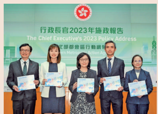
▲特区政府昨日公布《北部都會區行動綱領》，提出以產業導向規劃北都發展。