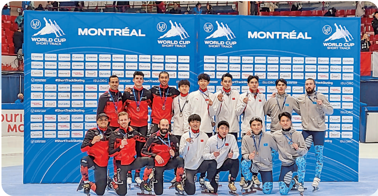
◀國家速滑隊奪冠後與亞季軍合照。

新赛季短道速滑世盃第2站至此落幕。11月3日至5日，四大洲錦標賽將在加拿大拉瓦爾舉行，世盃第3站賽事則將於12月8日至10日在北京打響。