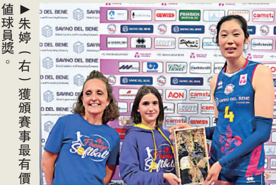
▶朱婷（右）獲頒賽事最有價值球員獎。

【大公報訊】意甲女排聯賽常規賽第4輪上週日舉行，中國女排隊將朱婷效力的斯坎迪奇於主場出戰卡薩爾馬焦雷。在朱婷拿下21分的協助下，斯坎迪奇以局數3：1取勝，這是該隊本季第