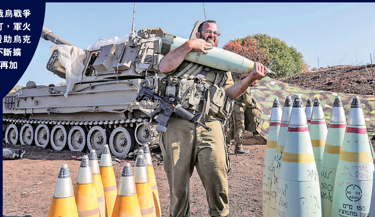
北約標準的155mm口徑炮彈價格大漲，圖為一名以色列士兵正在搬運一枚155mm炮彈。

近幾個月來，美國投入數十億美元改造工廠，提高軍備產能，還簽署了近250億美元的合同來援烏並補充美國庫存。歐洲各國政府也