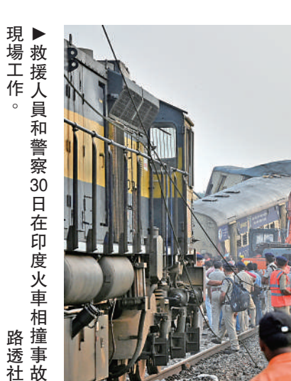
現場救援人員和警察30日在印度火車相撞事故。

據報道，事故發生後，33趟列車已取消，另外22趟列車已改道，鐵路官員預計受影響的軌道會在30日晚上恢復。