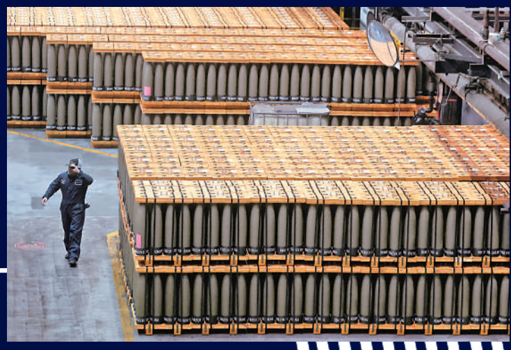
今年2月，美國賓夕法尼亞州的斯克蘭頓陸軍彈藥工廠內，一批155mm炮彈準備運出。