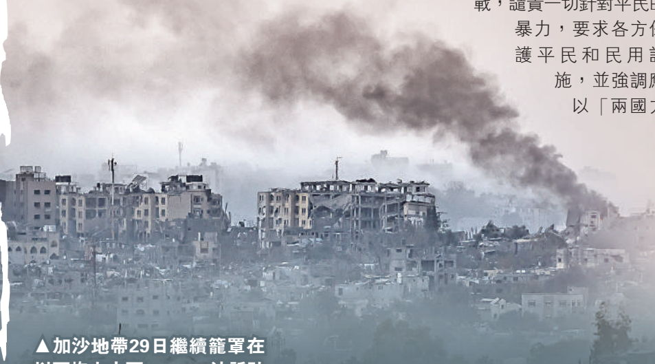
▲加沙地帶29日繼續籠罩在以軍炮火之下。

汪文斌表示，國際社會特別是廣大阿拉伯國家高度評價中方秉持的公正立場和發揮的負責任大國作用。汪文斌強調，只要有利於推動對話實現停火，恢復和平，中方都堅定支持。只要有助於落實「兩國方案」，推動巴勒斯坦問題全面公正持久解決，中方都將盡力而為。