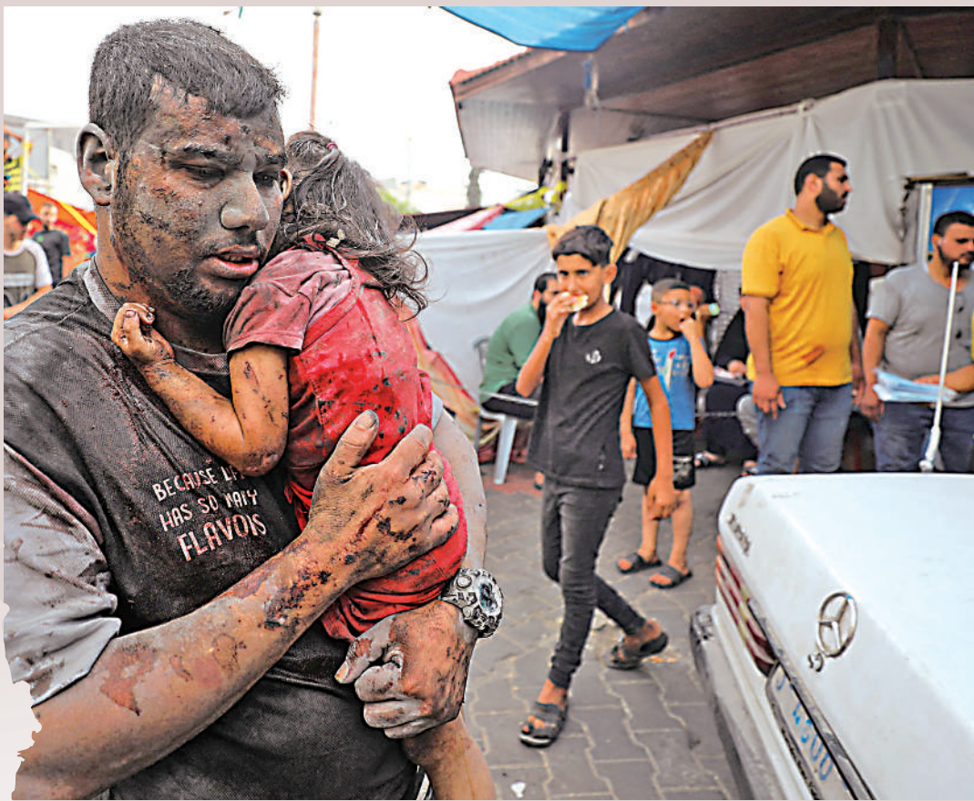
▲加沙城內的巴勒斯坦居民29日在以軍空襲中受傷。

《耶路撒冷郵報》29日援引消息人士報道稱，埃及警告以色列不要在埃及與加沙邊境處的費盧傑走廊開展軍事行動，並拒絕接受以色列就此前攻擊埃及哨所一事作出的道歉。以方稱攻擊埃及哨所是「意外事件」，但埃及認為這是蓄意挑釁。