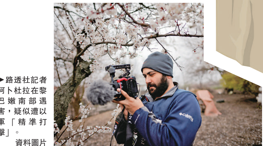
▶路透社記者阿卜杜拉在黎巴嫩南部遇害，疑似遭以軍「精準打擊」。