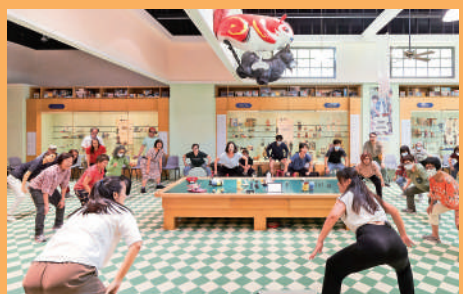
▲11月18及19日於香港文化博物館舉行「情繫香港——潮遊香港文化博物館」。