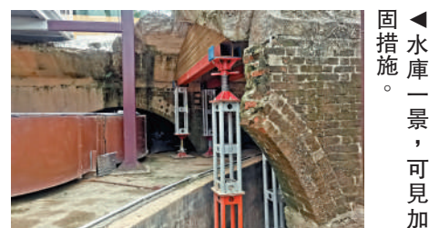
◀水庫一景，可見加固措施。