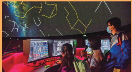
▲11月7日晚上在香港太空館舉行「天象廳幕後遊」。