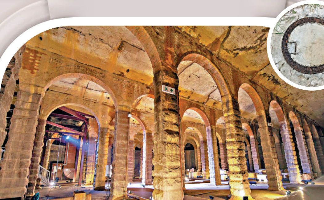
▲前深水埗配水庫是融合歐洲傳統風格花崗石柱與仿羅馬紅磚拱券的建築。

伴隨時間發展，今日的深水埗配水庫雖然沒了往日的功用，但它並未真正遠離人們生活，今人漫步其中，不僅可以欣賞建築特色，更可了解香港水務發展歷史，它是活生生的歷史證明。