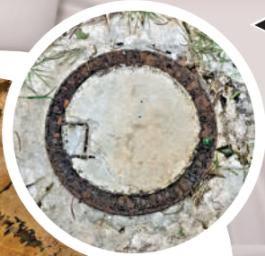
◀進入配水庫前，「邂逅」頗有年份的井蓋。