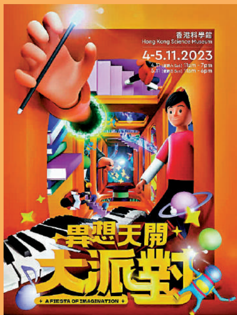
▲11月4日至5日在香港科學館舉行「異想天開大派對」。

康文署博物館通行證持有人亦可於博物館節期間享受特別開放時段，體驗精彩節目。有關博物館節活動詳情，可瀏覽網頁www.museums.gov.hk/mf2023。