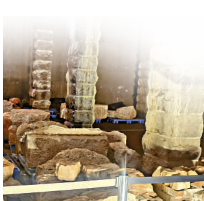
▲現場散落的碎石，應來自幾條斷裂石柱。

【大公報訊】康樂及文化事務署(康文署)將於11月期間舉辦「香港博物館節2023」，以「香港有歷史·藝術·科學·博物館」為主題，於轄下博物館及文化空間推出約80項精彩節目，讓市民享受多元藝術與文化。