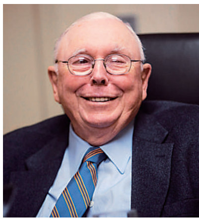
▲芒格認為，中國領先企業相比其他任何企業都更強大、更好，而且成本更低。