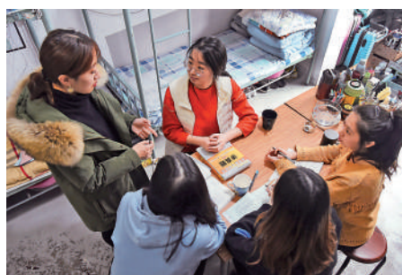
▲在青島理工大學一間宿舍，同學們分享學習心得。

排自己的生活。」學習博主們通常會選擇如考研、考公務員等具體的目標作為人設，人設本身就有非常龐大的受眾群