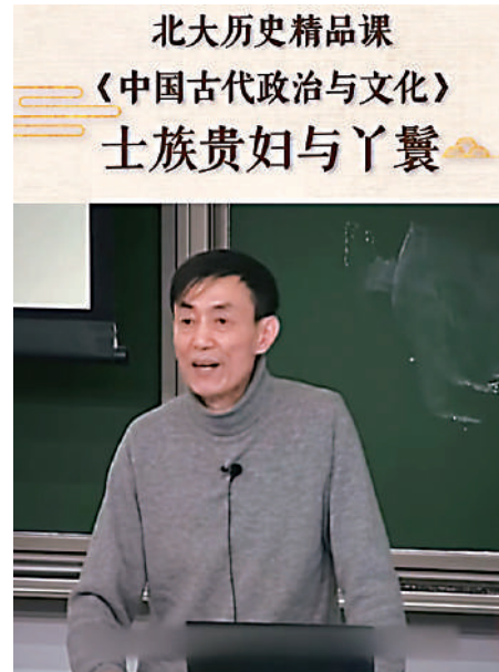
▲北大歷史系官方抖音賬號會定期發布精品課程。

復旦大學法學院副教授熊浩認為，文史哲課程在網絡「走紅」是一種必然。「以B站為例，用戶以90後、00後居多，他們生活在大數據和視頻時代，對知識的渴求不再止於「短、平、快」的內容，能夠啟發思考、以古論今的文史哲內容高度契合了其關注內心、關注精神世界的趨勢。」