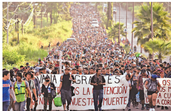
▲數千名非法移民徒步前往美墨邊境。

據報道，2022和2023財年，美國南部邊境扣押的移民人數均超過200萬。根據美國國土安全部的數據顯示，僅今年9月，美國邊境巡邏隊就逮捕了超過20萬非法移民。