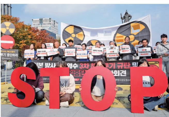
▲韓國民眾2日舉行集會反對日本排放核污水。

汪文斌表示，日本不顧國內外反對，已經向太平洋排放了15600噸核污染水，公然將污染風險轉嫁給全世界，極不負責任。最近剛發生的福島核電站放射性廢液洩射事故再次證明，負責核污染水排放的日本東京電力公司內部管理混亂、慣於隱瞞欺騙，日方宣稱的「安全、透明」的排海計劃根本不能令人信服。日方應正視國際社會普遍關切，同利益攸關方特別是周邊鄰國進行充分協商，以負責任方式處