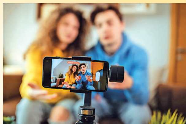
▲美歐多所大學都開設了指導學生如何運作網紅經濟的課程。圖為一對男女正在錄製視頻。網絡圖片